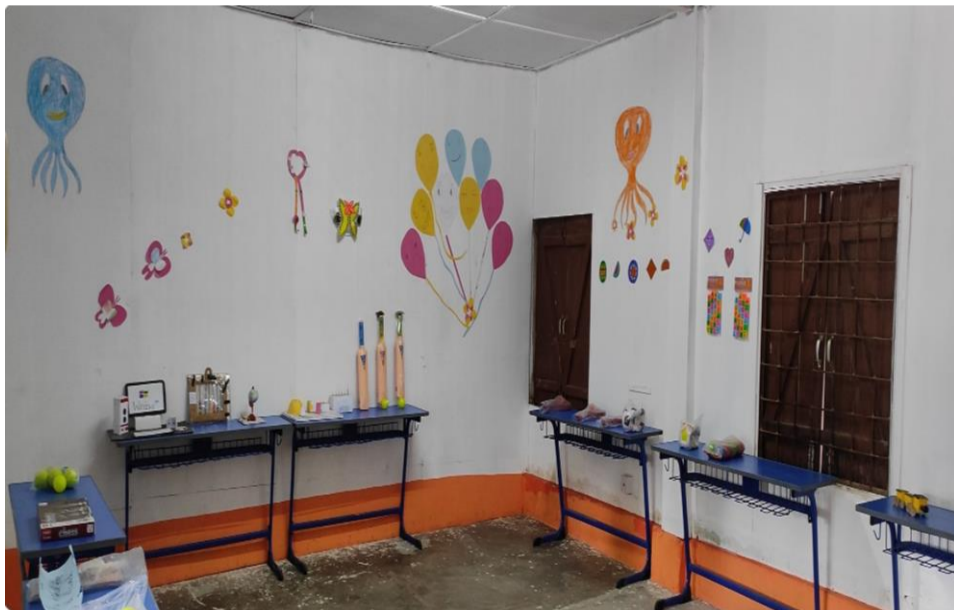
DVM Thangskai, Activity room decoration