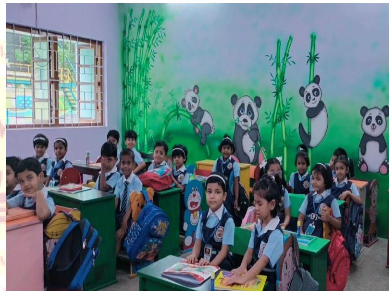
DVM Rajgangpur, Renovation