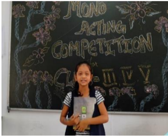
Mono acting competition was organized at Dalmia Vidya Mandir Thangskai