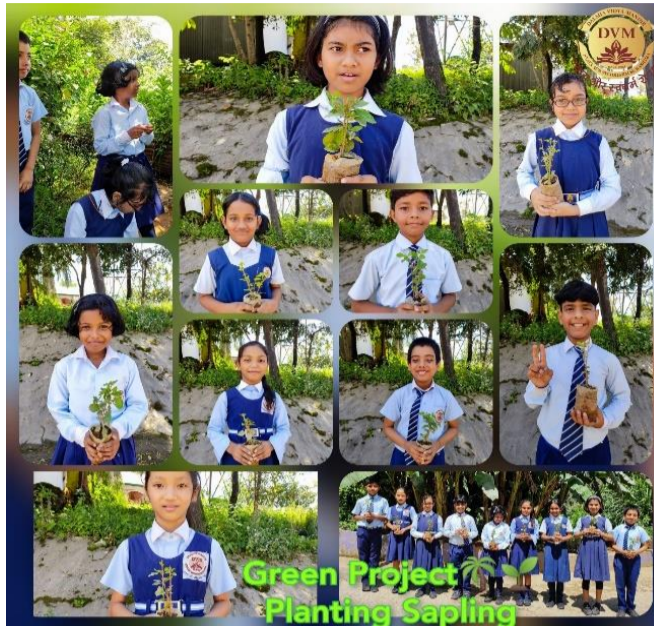
TREE PLANTATION IMPORTANCE @DVM THANGSKAI