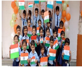
Flag making activity for tiny tots was organized at Dalmia Vidya Mandir, Chirawa.