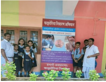
Mass drug administration conducted Filariasis elimination campaign in Dalmia Vidya Mandir, Rajgangpur school.