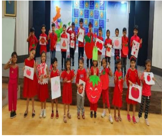
Inter School activities were organized for the students of Dalmia Vidya Mandir, Rajgangpur!