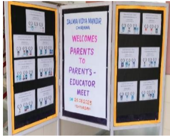
Parents educators meet was carried out at Dalmia Vidya Mandir Chirawa.