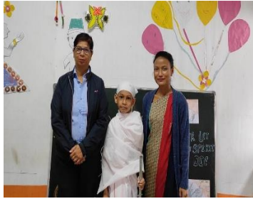
Quit India Day was observed at Dalmia Vidya Mandir in Thangskai.