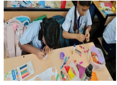
Clay modelling activity was organized at Dalmia Vidya Mandir, Chirawa for tiny tots.