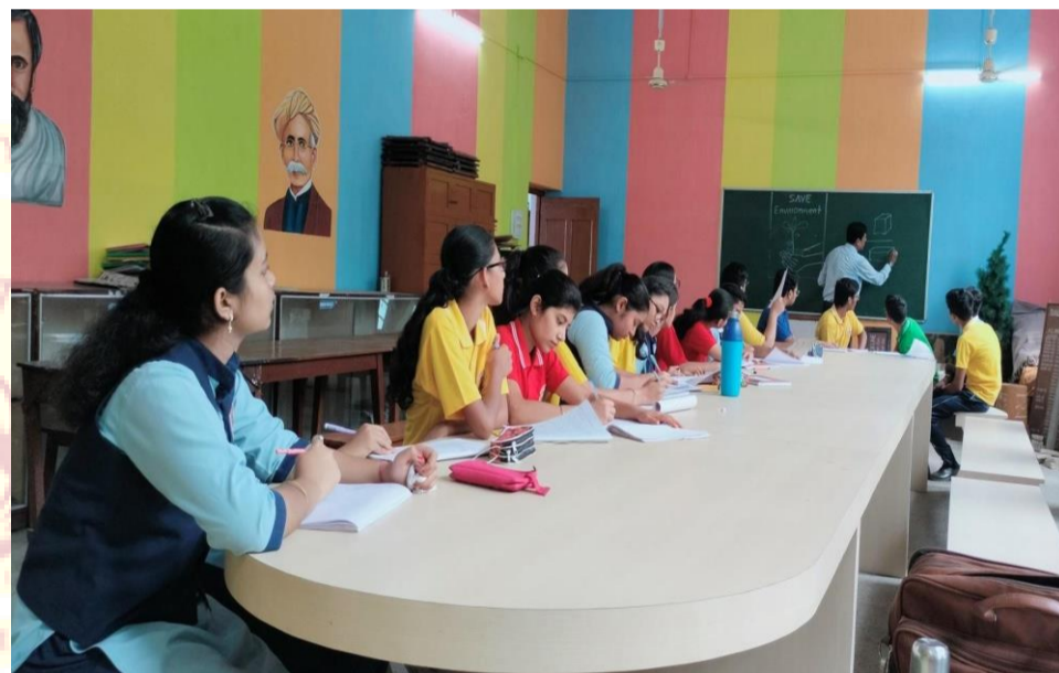
DVM Rajgangpur, Renovation