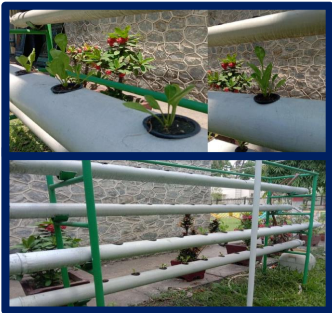
HYDROPONICS @DVM RAJGANGPUR