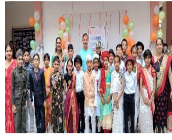
Dalmia Vidya Mandir, R-Chirawa organized a Patriotic dress-up competition.