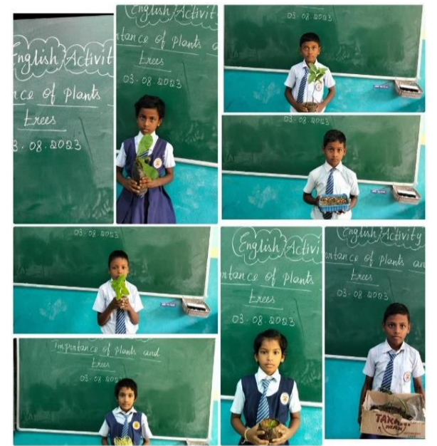
TREE PLANTATION IMPORTANCE @DVM DALMIAPURAM

Dalmia Vidya Mandir undertakes various green initiatives in its school premises to promote environmental sustainability. One such noteworthy project is the implementation of hyphonic systems in DVM Rajgangpur, which has been recognized and awarded by the Indian Green Building Council (IGBC).