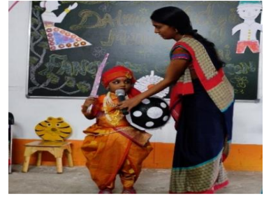
Fancy dress competition was organized for the students at Dalmia Vidya Mandir, Rajgangpur.