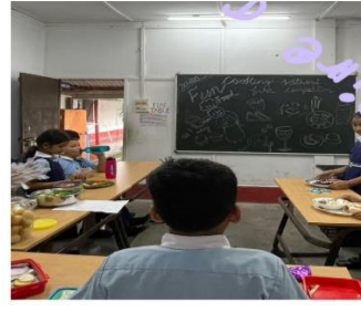
Fireless cooking competition was held at Dalmia Vidya Mandir, Thangskai.