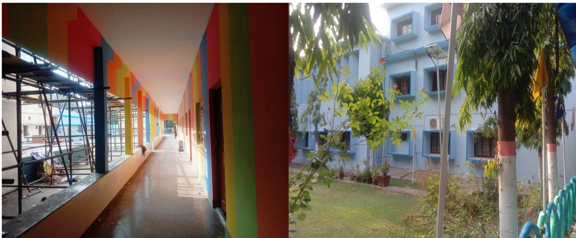
DVM Rajgangpur, School Painting