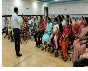
A parent-teacher conference was held at Dalmia Vidya Mandir, Rajgangpur, with the school principal in attendance.