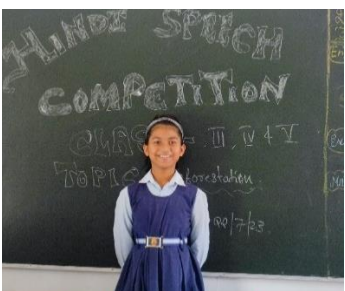
On July 22, 2023, Dalmia Vidya Mandir hosted a thrilling Hindi speech competition on deforestation!