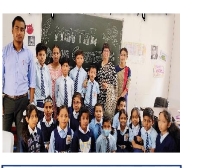
On July 29th, 2023, a Mental Maths competition was held at Dalmia Vidya Mandir in Thangskai.