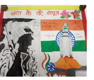
A drawing competition was held at Dalmia Vidya Mandir, Kalyanpur.