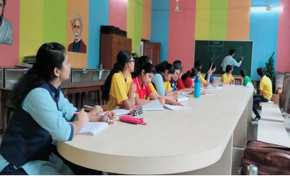
DVM Rajgangpur, Renovation